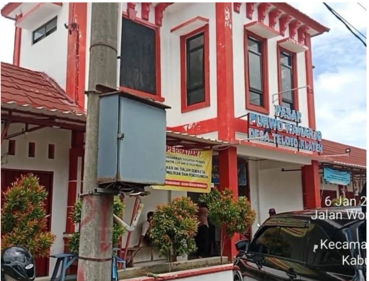
Foto: Pasar Purwo Raharjo di Desa Teloyo, Kecamatan Wonosari, Kabupaten Klaten, kembali memicu perhatian publik.

KLATEN - Polemik sengketa tanah Pasar Purwo Raharjo di Desa Teloyo, Kecamatan Wonosari, Kabupaten Klaten, kembali memicu perhatian publik.